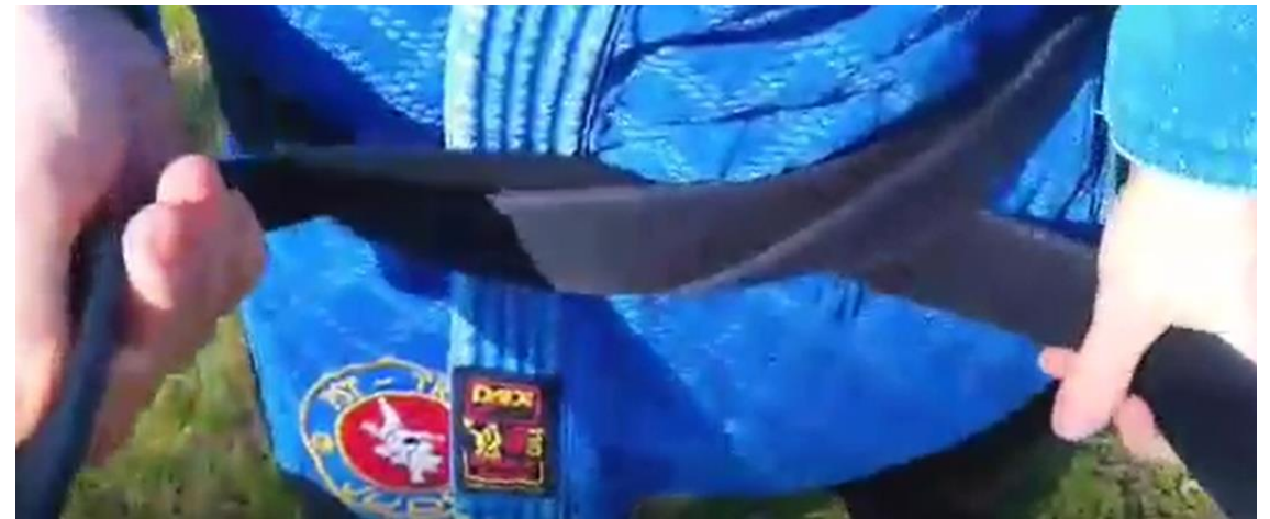
Darauf achten, dass beide Gürtelenden gleich lang sind