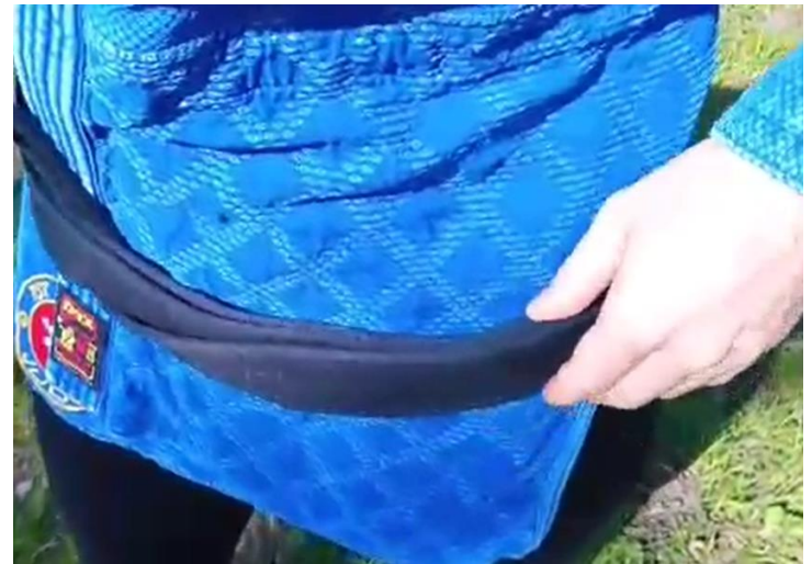
Unteres Gürtelende unter beiden Lagen herausziehen