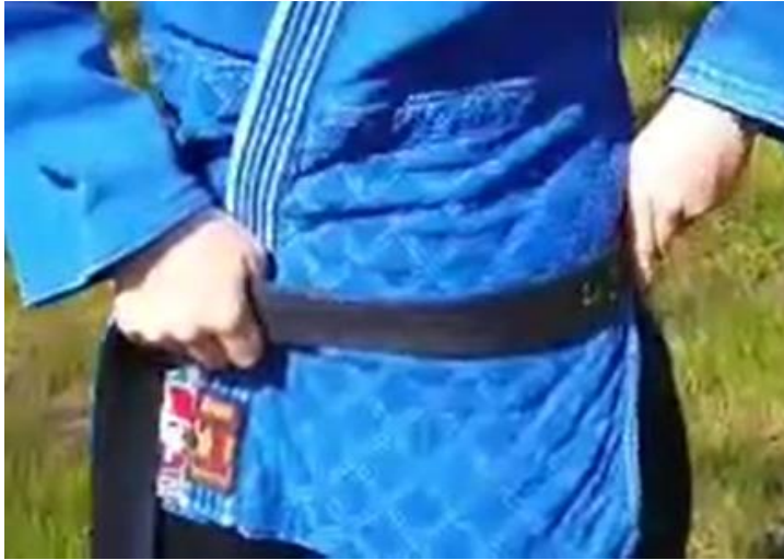
Endstück links seitlich anlegen