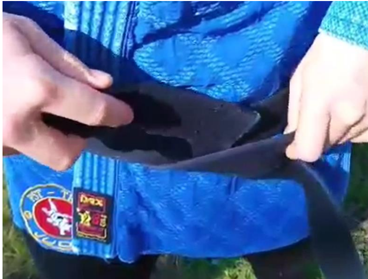
Rechtes oberes Gürtelende nach links zwischen die beiden Gürtellagen stecken