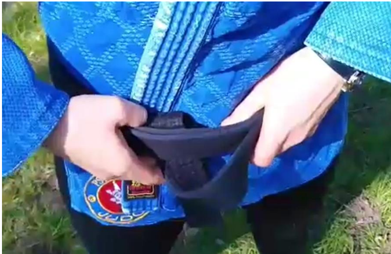
Oberes Gürtelende unter beiden Lagen durchschieben