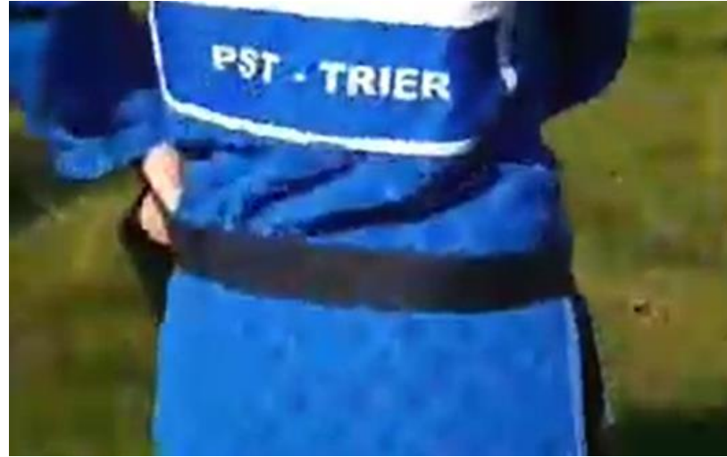
Gürtel um den Körper rollen